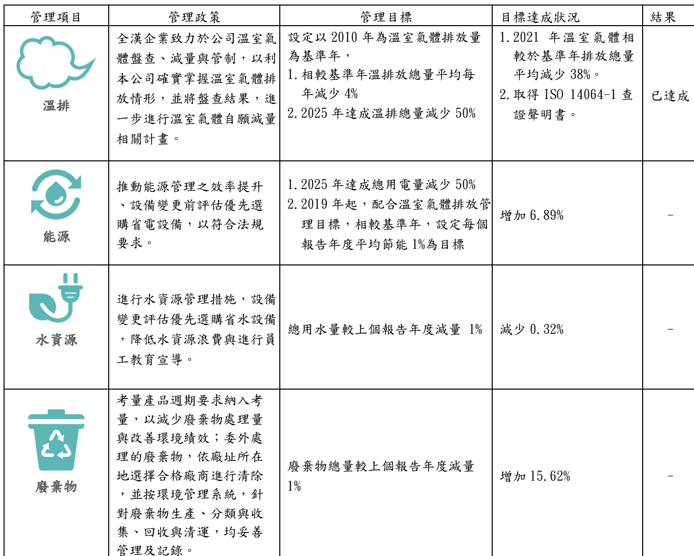
附表3 永續報告書數據品質資訊